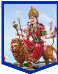
वैष्णो देवी मंदिर