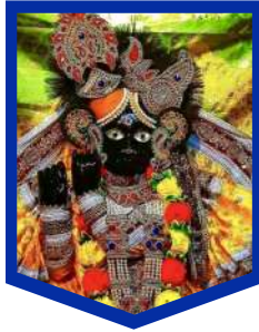
बाँके बिहारी मंदिर