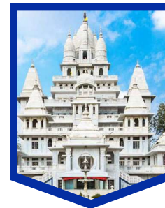
श्री पागल बाबा मंदिर