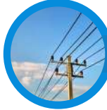
बिजली के खम्भे