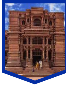
गोविंद देव जी मंदिर